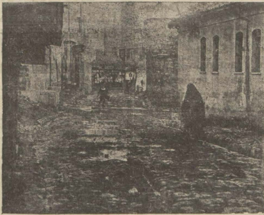
Şehir yollarından bozak kaldırımli bir şose

Şehre ait yollarla Nafiaya ve bilnetice devlete ait yollar meselesi ötedenberi halledilemez bir mesele halindedir. Son zamanda şehir yollarının tamir ve inşaatında Nafia vekâletinin bazı yardımlarda bulunacağı bildirildi. Böyle bir kararın ehemmiyeti azımdı ve şehir için çok faydalı neticeler verebilirdi. Bu mesele hakkında etrafı malûmat almak için Nafia başmühendisliğine müracaat ettik. Şu menfi malûmatı aldık: