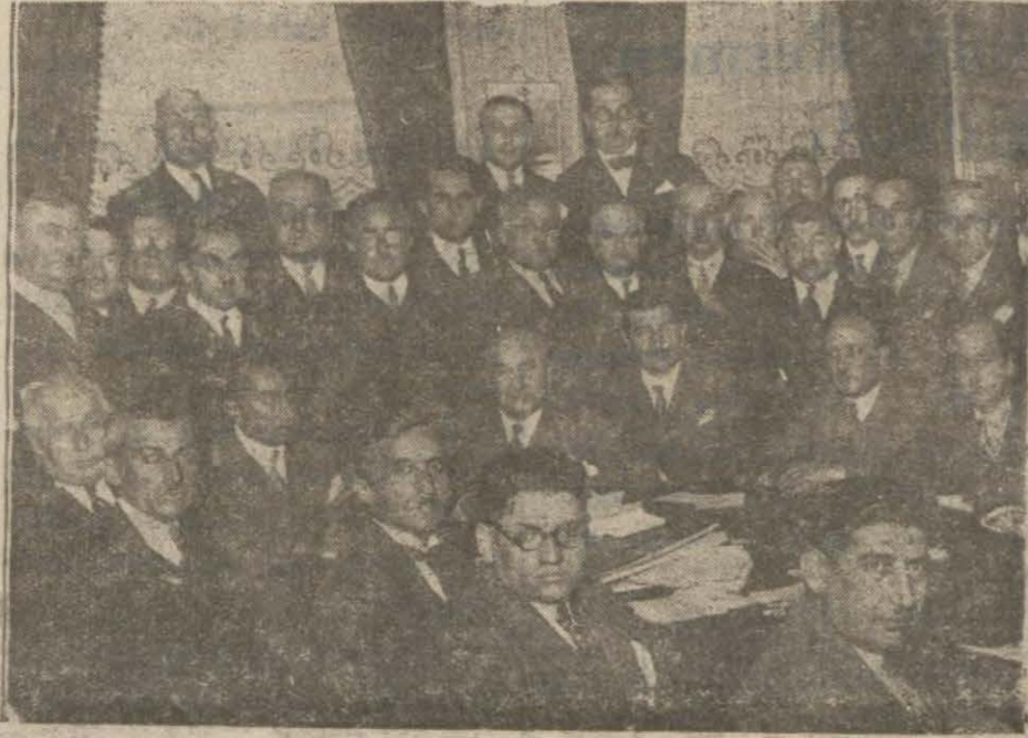
Müfuz tacirlerine dair birçok şikâyetnameler alan Halk Fırkası heyeti faaliyet halinde

Teşkil Edilecek Olan "Halk Evleri," Ne gibi Vazife Görecektir?