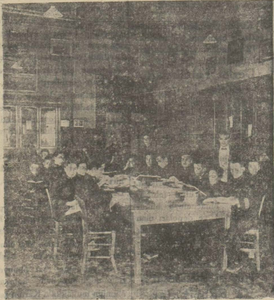
Cemiyetin idare ettiği Darüşşefekada bir çalışma sahnesi.

Darüşşefekayı idare eden Cemiyeti Tedrisiyeyi İslâmiyenin umumi menfaatlere hizmet eden cemiyetlerden sayılması hakkında Maarif ve Dahiliye vekâletlerine yapılan müracaat Şurayı devlete sevk edilmişti. Şurayı devlet bu hususta müs-